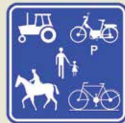
▲ De Werenberg wordt een landbouwweg

De Werenberg wordt door veel inwoners recreatief gebruikt (wandelen, fietsen). Na de ingebruikname van de fietssnelweg Boutersem (brug over spoorweg in Boststraat) – Bierbeek, zal het fietsverkeer nog toenemen. Daarom zal de Werenberg vanaf het kruispunt met de Drogenhof en het kruispunt met de Boststraat een landbouwweg worden, zodat sluipverkeer vermeden wordt.