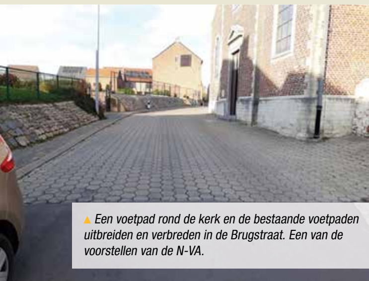
▲ Een voetpad rond de kerk en de bestaande voetpaden uitbreiden en verbreden in de Brugstraat. Een van de voorstellen van de N-VA.