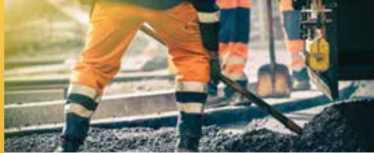
Grondige renovatie Smidstraat (p. 3)